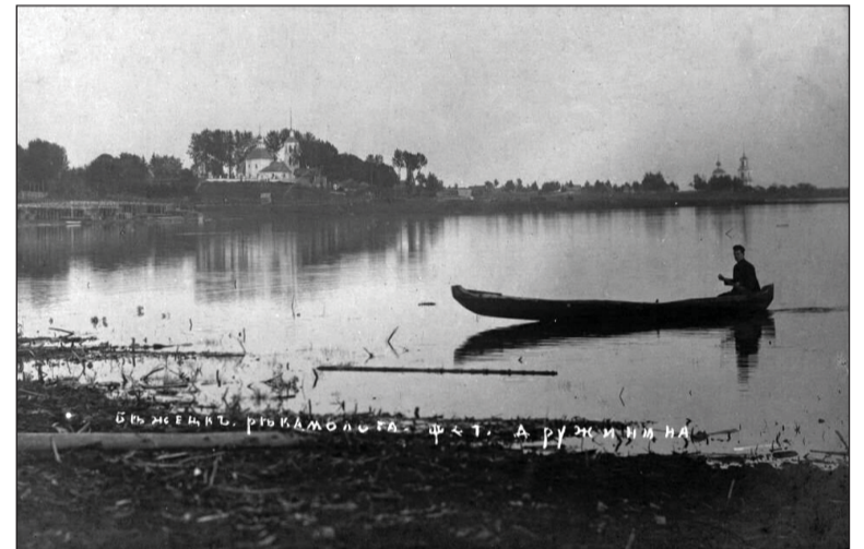
Бежецк, река Молога. Фотооткрытка издания П.М. Дружинина. 1912–1914 гг. Из открытых источников.