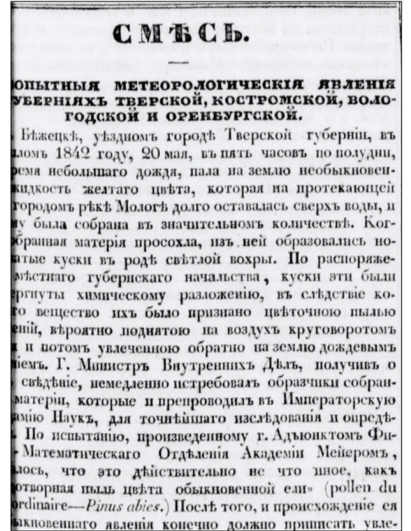
Заметка о любопытном метеорологическом явлении в Бежецке. Русский инвалид. 1843. № 11. С. 41.

ком академика) по ботанике. К.А. Мейер вошел в историю как крупный ученый, путешественник, академик Петербургской академии наук (1845). В экспедициях он впервые описал около 2 тыс. видов растений, в т. ч. около 100 новых видов и 9 родов растений Центрального Кавказа, Армении, Азербайджана, Туркестана. Именно К.А. Мейер впервые систематически описал знаменитый «корень жизни» – женьшень. С 1851 года и до смерти Мейер являлся директором Петербургского ботанического сада.