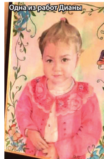
Одна из работ Дианы