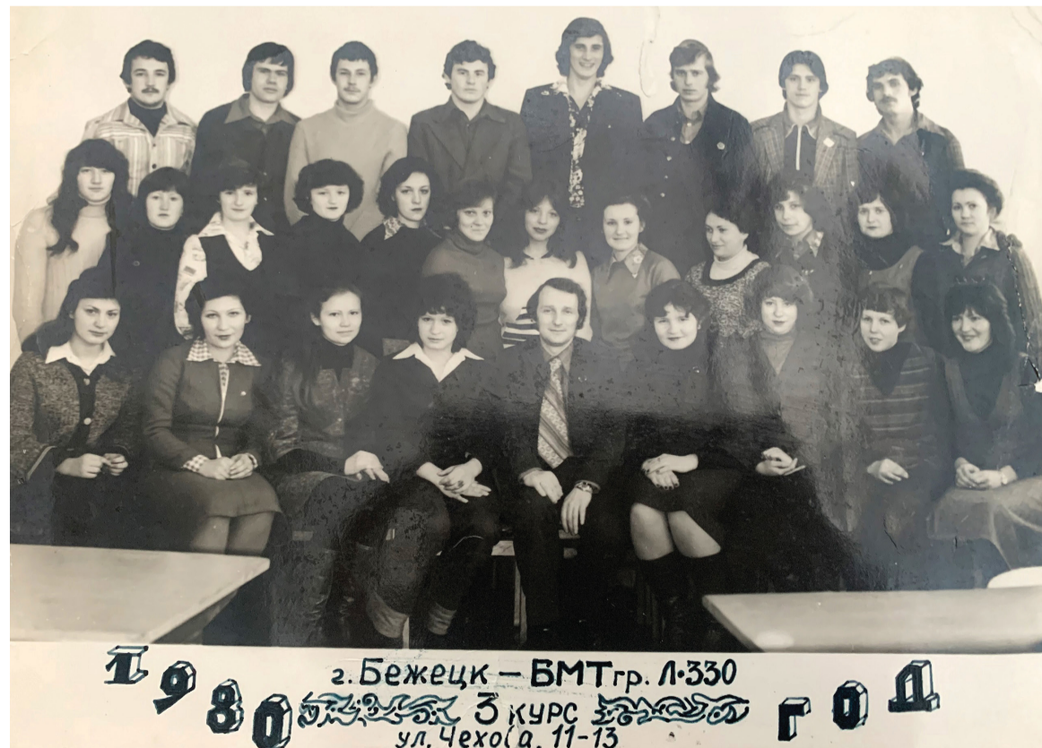
1980 г. 3 курс г. Бежецк – БМТ гр. Л-330 ул. Чехова, 11-13

оформлению кабинетов, оснащению их современным оборудованием. Для лаборатории «Технологическое оборудование» были приобретены действующие робототехнические комплексы.