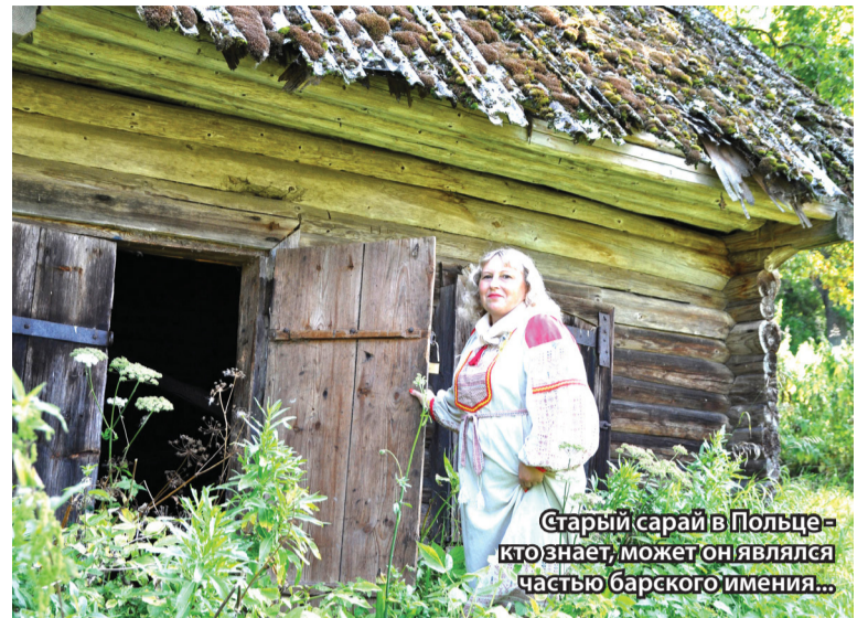
Старый сарай в Польце - кто знает, может он являлся частью барского имения...