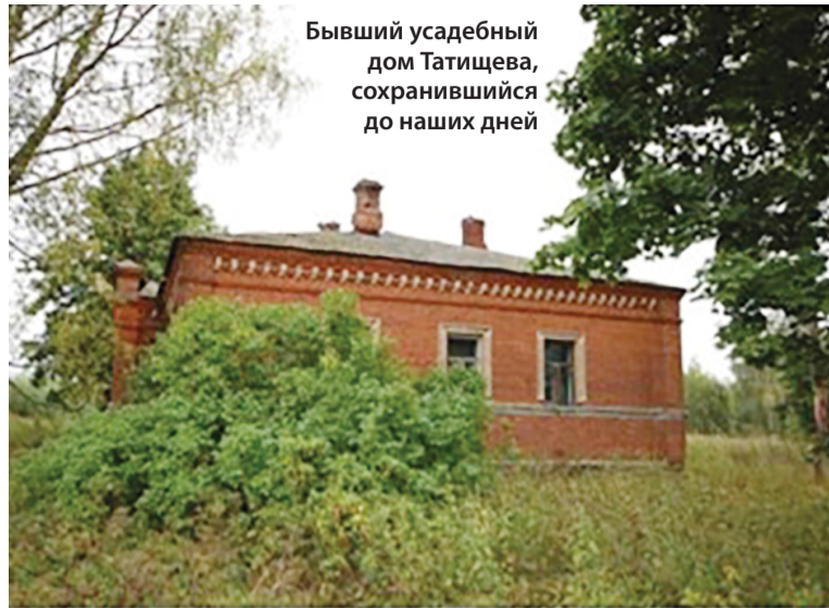
Бывший усадебный дом Татищева, сохранившийся до наших дней