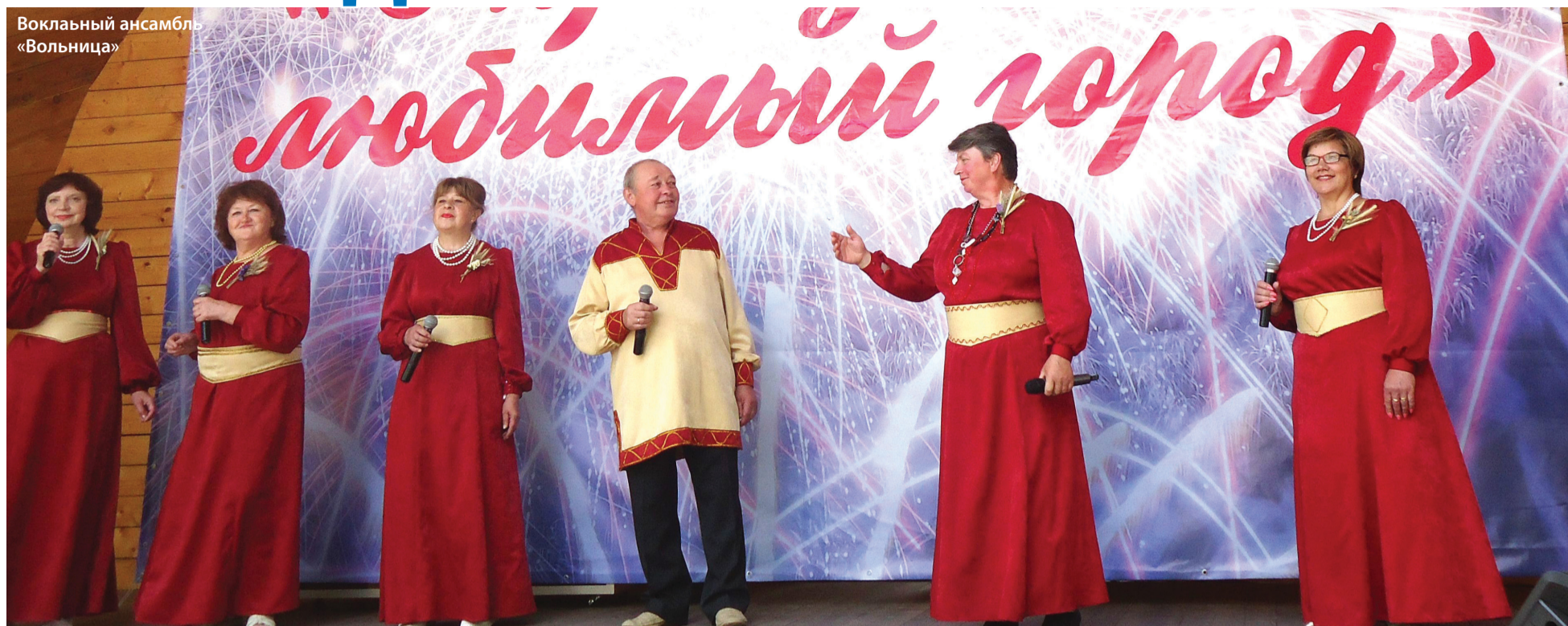
Вокляный ансамбль «Вольница»