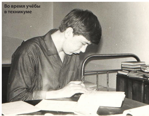
Во время учёбы в техникуме