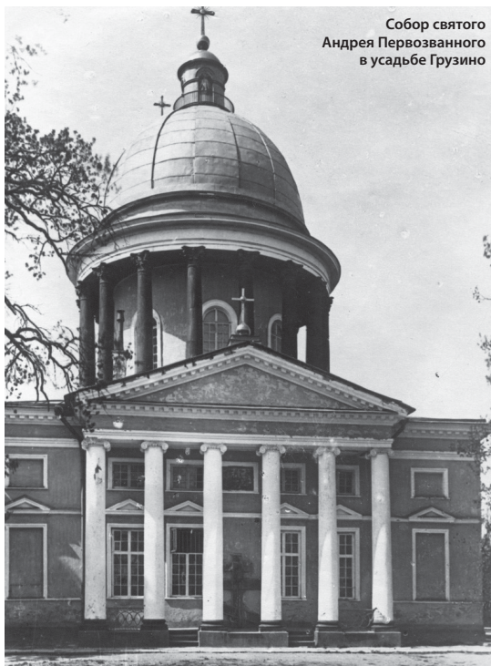
Собор святого Андрея Первозванного в усадьбе Грузино

им не удалось. Попавшийся навстречу в соседней комнате врач тотчас же его остановил, объяснив, что движение может сделать ему вред. Тогда граф приказал посадить себя в той же комнате на кресло против бюста, на серебряной колонне стоящего; говорил со мною о многом, и когда подали огонь, просил меня читать ему газету, что продолжалось часа полтора; потом приказал положить себя на диван в комнате, где он лежал; но лежать не мог, сел на том же диване обложенный подушками и скончался в субботу утром, в то самое время, когда за заутренней носили плащаницу кругом Грузинского собора». Умер Аракчеев на диване, на котором спал император Александр I во время его визитов в Грузино, под портретом своего благодетеля.