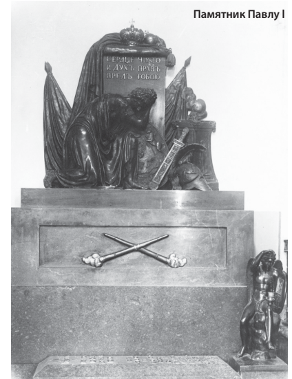
Памятник Павлу I

Похоронили графа в полотняной рубашке, когда-то подаренной ему великим князем (будущим императором) Александром Павловичем. Эту рубашку он хранил как драгоценную реликвию.