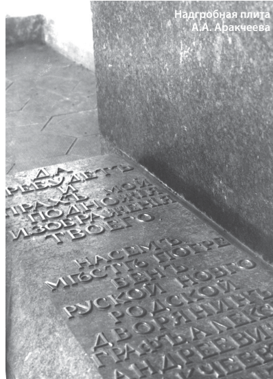
Надгробная плита А.А. Аракчеева