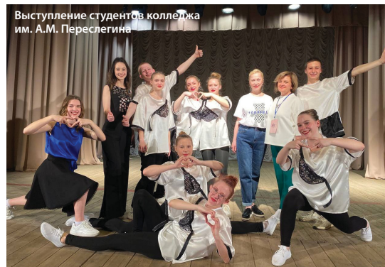
Выступление студентов колледжа им. А.М. Переслегина