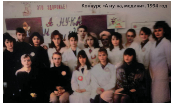
Конкурс «А ну-ка, медики». 1994 год