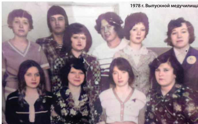
1978 г. Выпускной медучилища