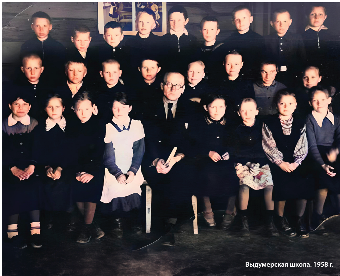
Выдумерская школа. 1958 г.

Приближается один из самых долгожданных праздников – Новый год. Его ждут дети и взрослые. Ребятушки встретятся с Дедом Морозом и Снегурочкой, получат подарки. Для людей постарше будет приятным дружеское общение, пожелание себе и родственникам под звон курантов доброго здоровья, успехов в делах. Я, человек послевоенного поколения, родилась в деревне Узменского сельского совета, расскажу о том, каким было для нас празднование Нового года.