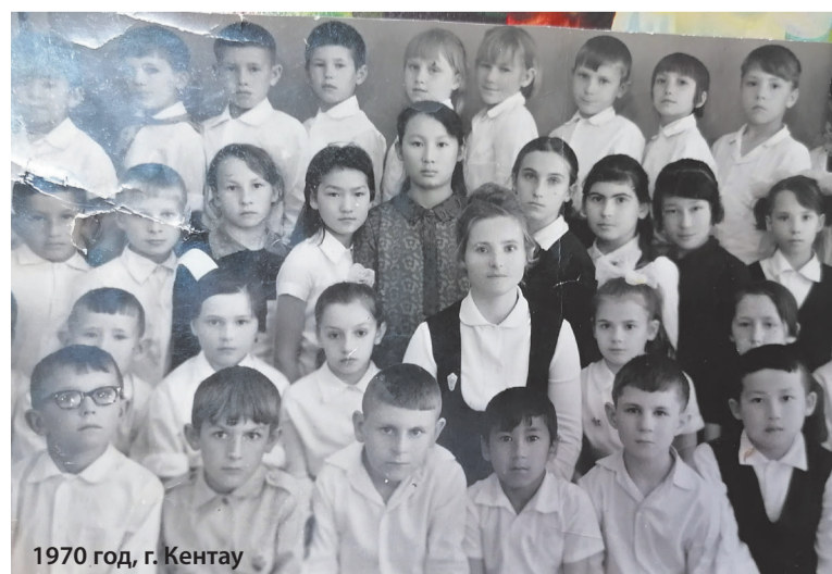
1970 год, г. Кентау

вы можете подать частное объявление (некоммерческое): - по СМС тел. 8-910-530-73-35 - по тел. 2-28-33 - по эл. почте на адрес: bezhvest@mail.ru - отправить по почте на адрес: Бежецк, пер. Андреева, дом 21 В текущий номер объявления принимаются до 12 ч. вторника. Позже только платные.