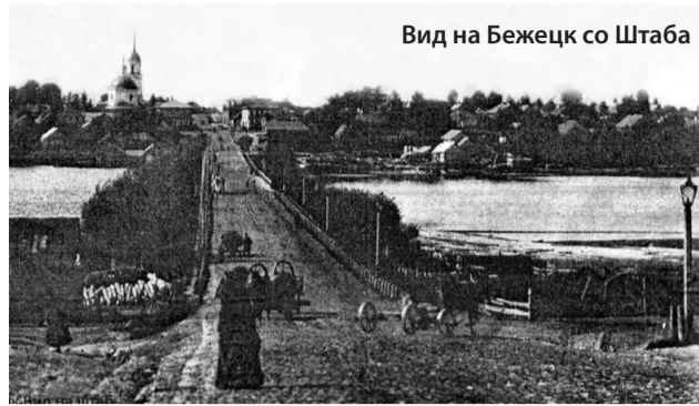
Вид на Бежецк со Штаба

К Дню рождения города и в рамках празднования 150-летия нашего земляка-писателя В.Я. Шишкова Бежецкая центральная районная библиотека объявила литературный конкурс эссе «Пишем историю». Итоги этого конкурса были подведены 5 августа на встрече любителей поэзии «Библиотечный дворик». Победителям были вручены дипломы и подарки. Участникам необходимо было написать небольшое эссе по предложенной фотографии старого Бежецка. Учитывалось знание истории родного города, творческий подход, оригинальность подачи материала, стилистическая и языковая грамотность. Сегодня мы публикуем работы победителей этого конкурса.