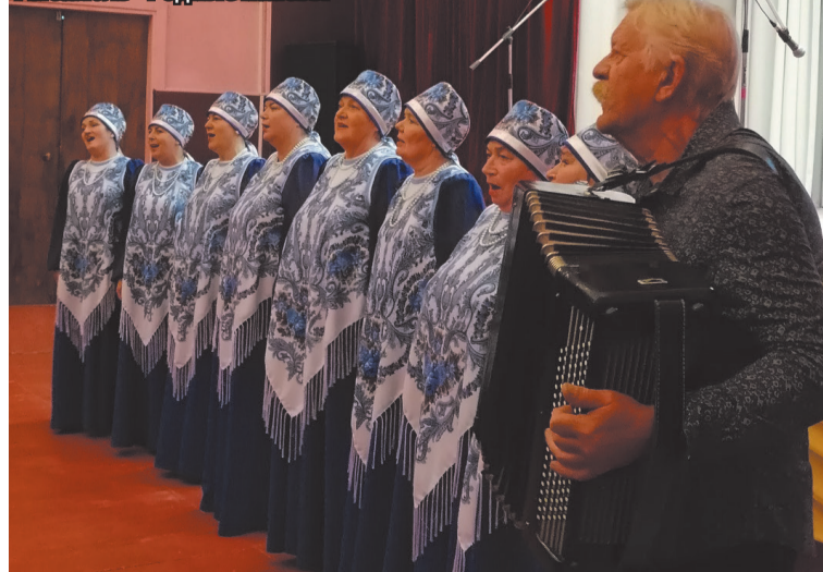
Ансамбль «Родные напевы»

По информации администрации Бежецкого района