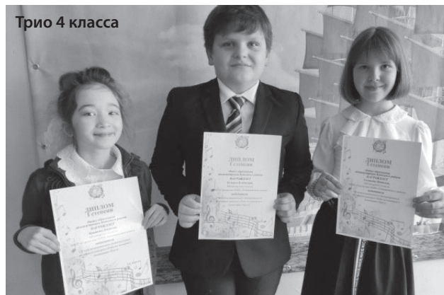
Трио 4 класса