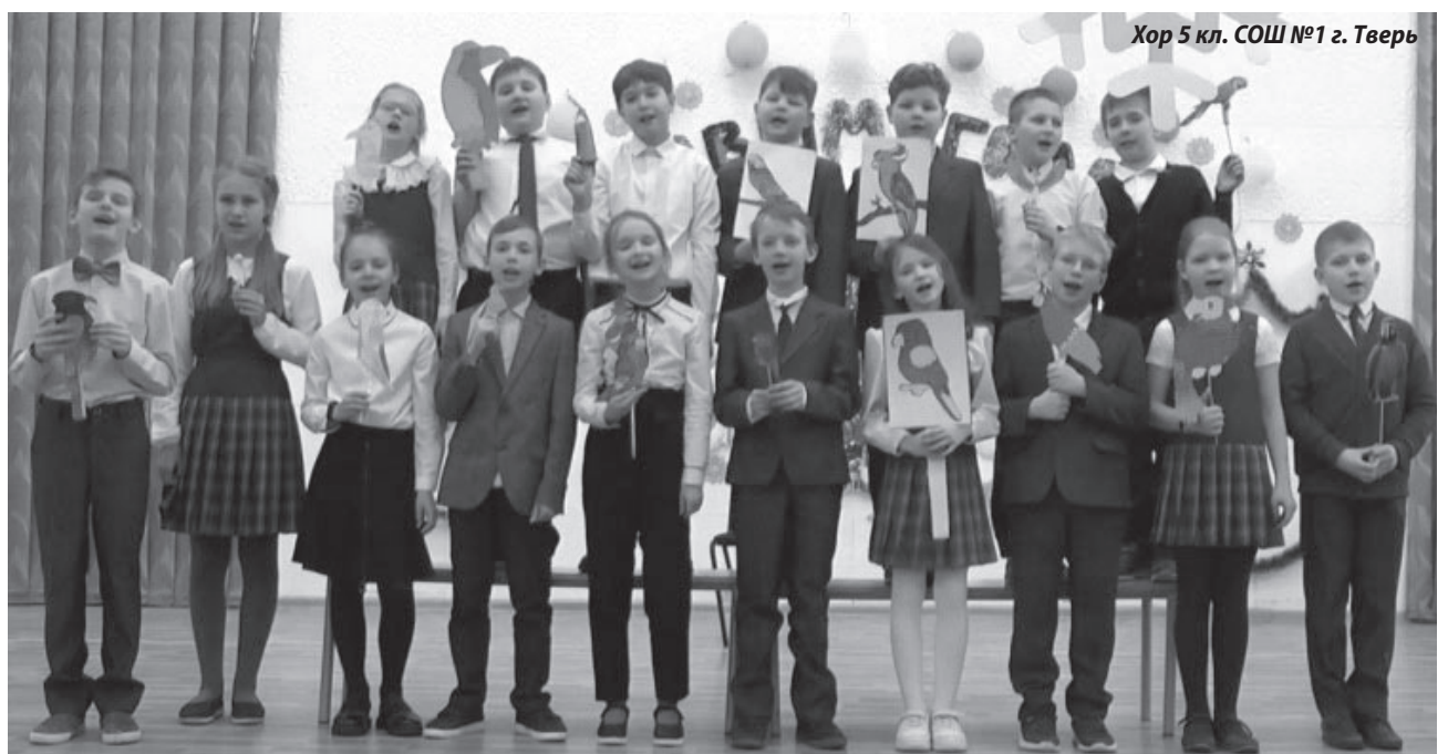
Хор 5 кл. СОШ №1 г. Тверь