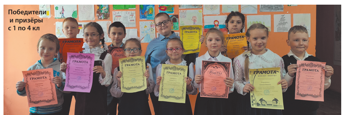
Победители и призёры с 1 по 4 кл