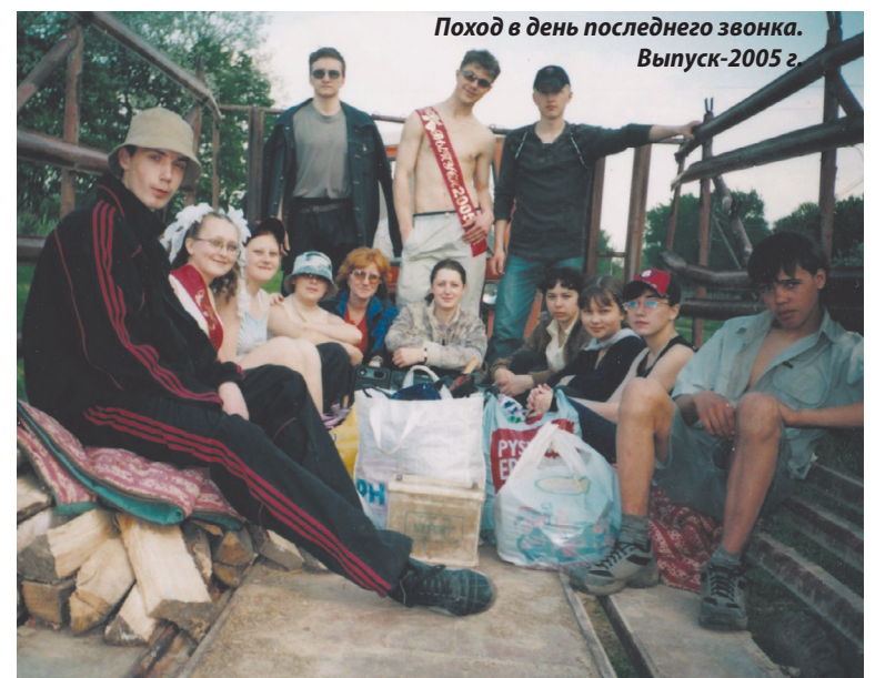
Поход в день последнего звонка. Выпуск-2005 г.