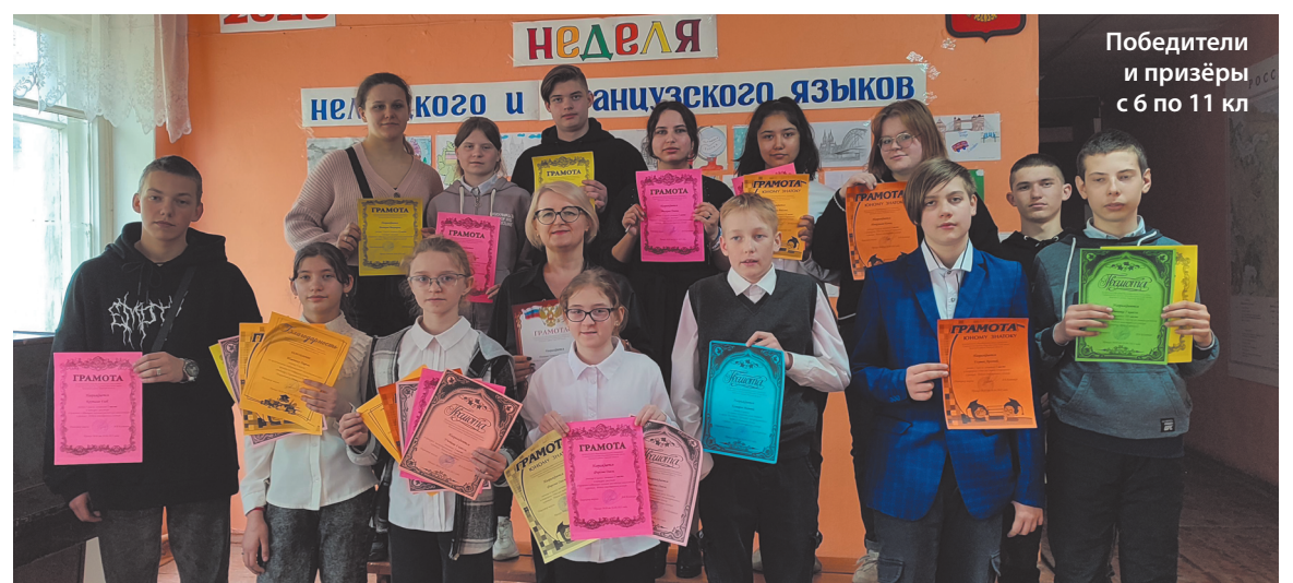
Победители и призёры с 6 по 11 кл