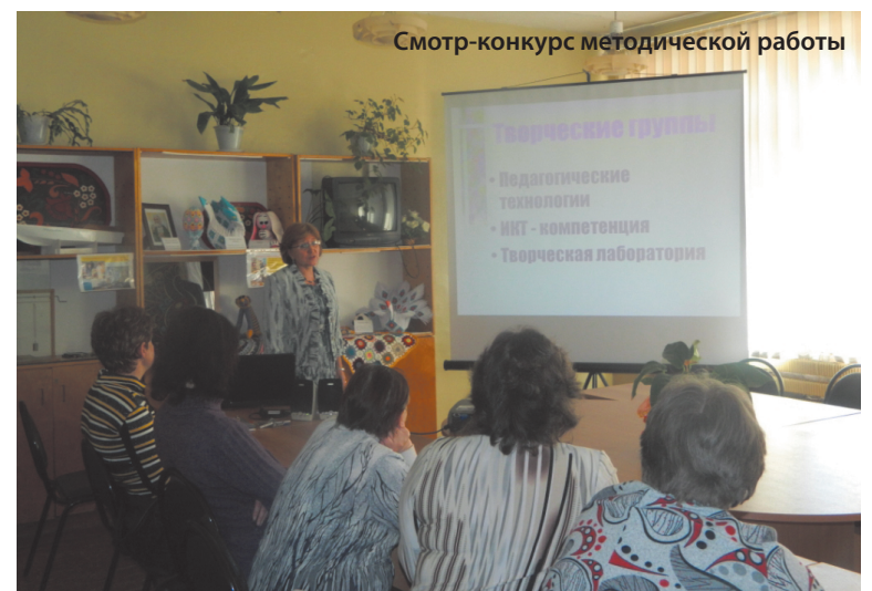
Смотр-конкурс методической работы