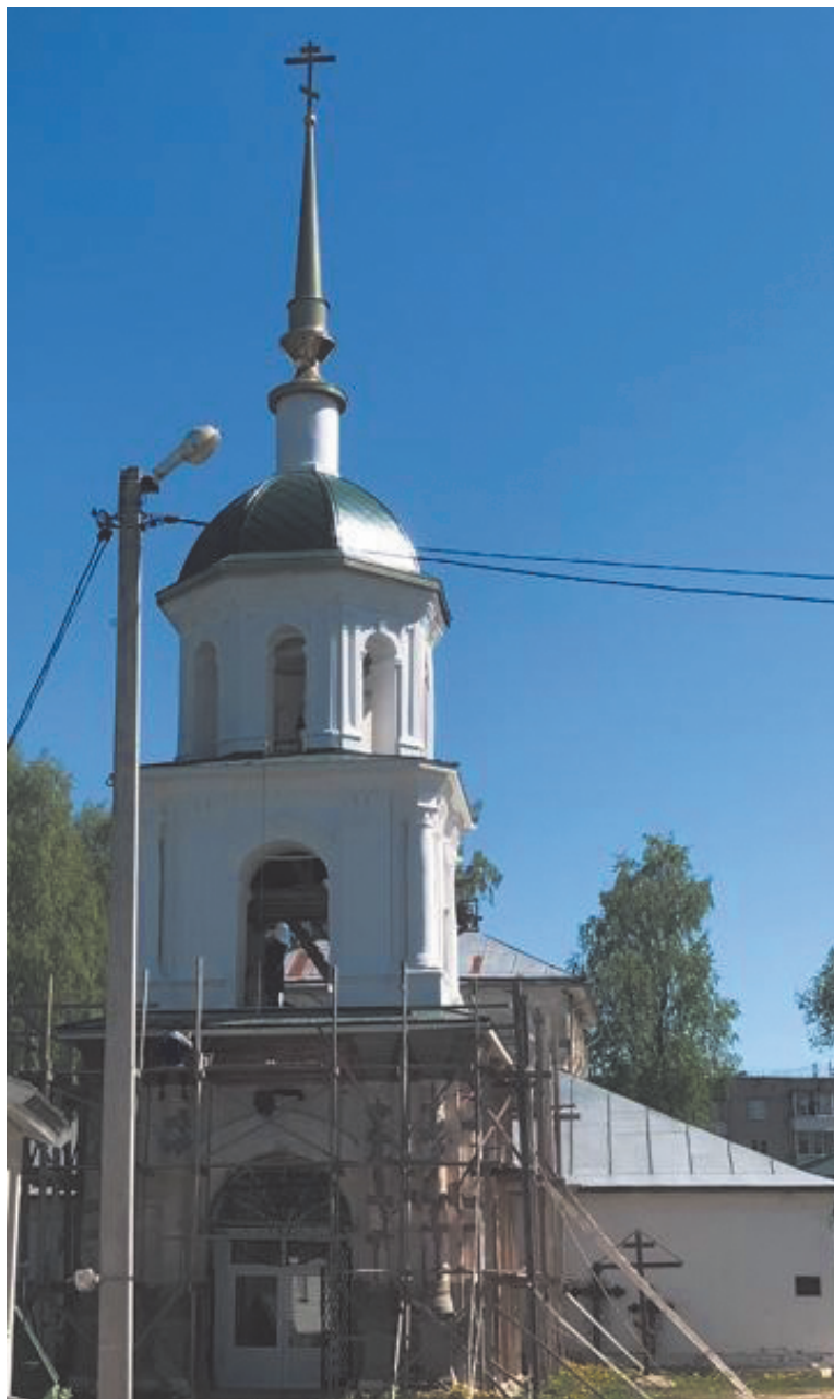
Отвѣты на вопросы фотосканворда, опубликованного в № 18