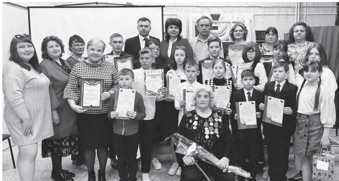
Уважаемые читатели! Продолжаем знакомить с творческими работами участников межмуниципального патриотического форума "Наша Победа". В прошлых номерах мы публиковали стихотворения, сегодня - сочинения школьников.