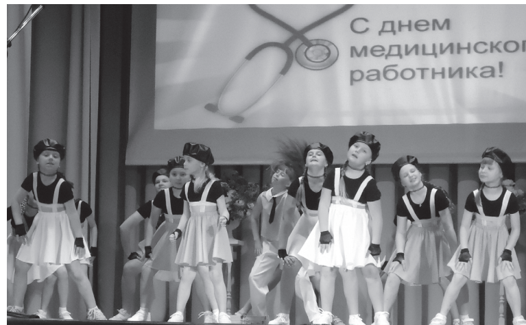
Студия танца «Dance kids»