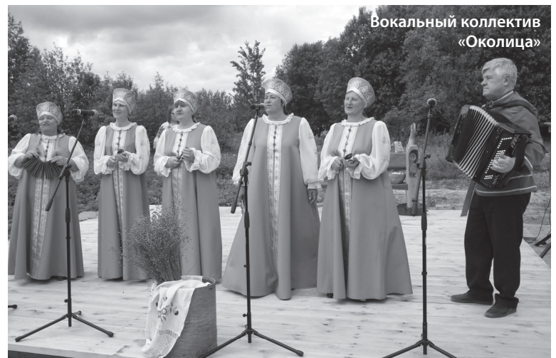
Вокальный коллектив «Околица»