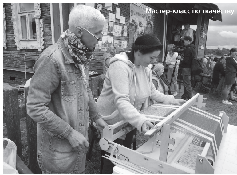
Мастер-класс по ткачеству